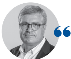
Marc WALLERICH Président des tribunaux administratifs de la Martinique et de Saint-Pierre-et-Miquelon

Qu'il s'agisse des affaires de santé publique (demandes de dépistage systématique, mise à disposition de masques à la prison de Ducos), de libertés publiques (limitation des déplacements aériens, couvre-feu) ou d'environnement (lutte contre l'échouage des sargasses, arrêté antipesticides), le tribunal administratif a su répondre en 2020, souvent dans des délais très brefs, aux préoccupations quotidiennes des requérants et à la demande de justice qui s'est exprimée en cette année si particulière. Touchée à deux reprises par des périodes de confinement, la communauté juridictionnelle a su s'adapter en faisant évoluer ses pratiques par un recours renforcé au télétravail et un échelonnement des audiences, afin de garantir un accueil sécurisé des justiciables, en mobilisant